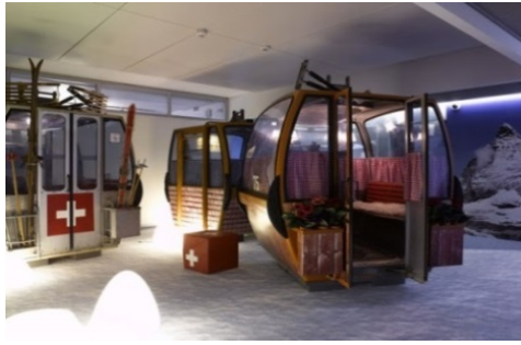
Les télécabines pour téléphoner