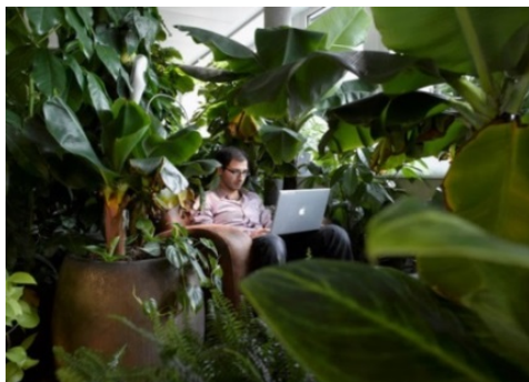
L'espace détente de la cafétéria