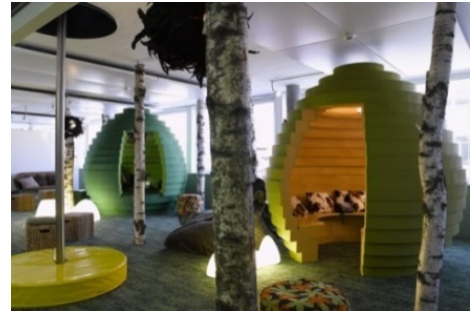
Les ruches pour les réunions